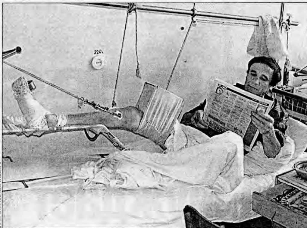
• Еще не все лечебные учреждения города оборудованы противопожарной сигнализацией