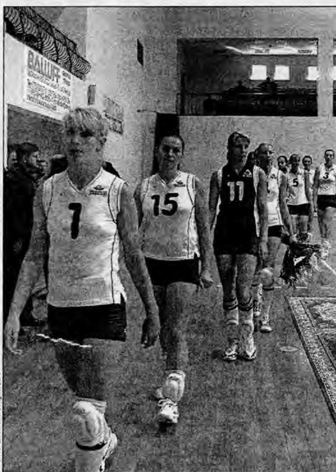
• Не раз в этом сезоне «Атлант» покидал площадку победителем

игру в третьем туре с новополоцкой «Дружкой» и представители «Ковровщика» приезжали в конце октября в Барановичи, чтобы посмотреть на игру «Атланта» с «Надеждой» (г. Гомель). Их опасения